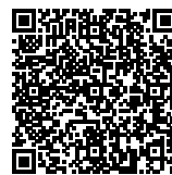
SYAHID Asesor Kompetensi